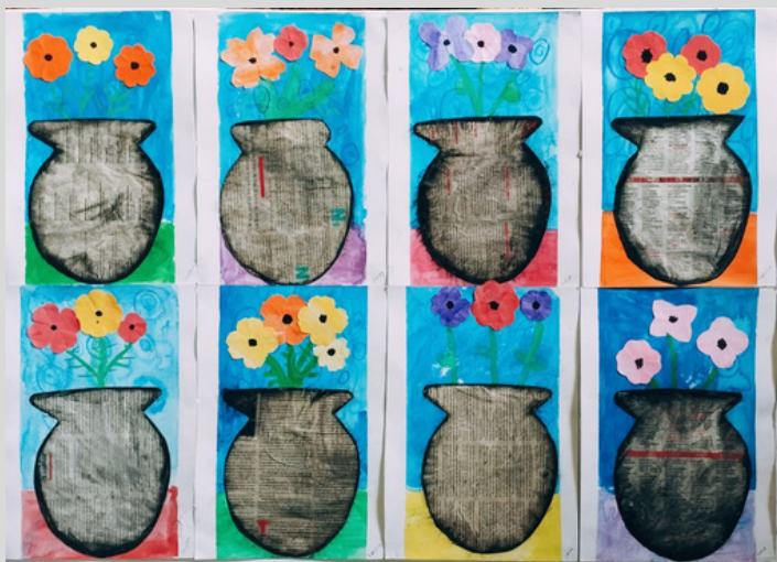
TRABALHOS DE ARTE DO 1º ANO